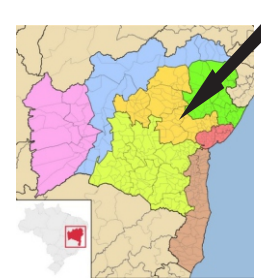
Mapa da Bahia