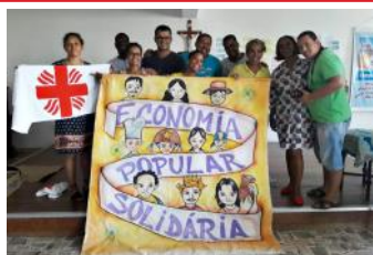
Participantes do Encontro

A Cáritas Regional Nordeste 3 reuniu, em Salvador, nos dias 27 e 28 de janeiro de 2016, no Instituto Frei Ludovico, representantes de Cáritas Diocesanas e de grupos produtivos que desenvolvem ações de Economia Popular Solidária (EPS) para elaborar um plano operacional anual dessa área de atuação. Leia mais