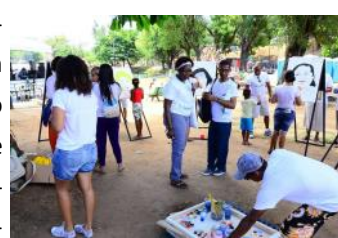
Ato “Somos da Paz”

Organizações, pastorais e movimentos sociais, que fazem parte da Articulação do Grito dos/as Excluídos/as, dentre estas a Cáritas Regional Nordeste 3, além de representações de diferentes expressões