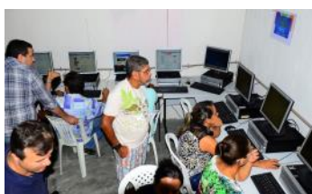
Momento da inauguração

A Cáritas Regional Nordeste 3, EMARTES e o SERPRO (Serviço Federal de Processamento de Dados) inauguraram no final tarde de ontem, o 7º telecentro comunitário, localizado no bairro Colina das Mangueiras.