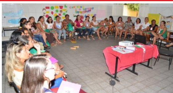
Educadoras reunidas na oficina "Contextualizando na educação infantil"

Várzea do Poço, cidade localizada no Centro Norte Baiano, região do Piemonte da Diamantina, distante 300 km de Salvador, sediou de 30 de novembro a 03 de dezembro o 1º Intercâmbio Regional de Educação Contextualizada no semiárido baiano. A escolha do local não foi por acaso. Nesse município se desenvolve um trabalho de educação contextualizada consolidado no campo e na cidade e que foi iniciado nos primeiros anos da década de 2000 a partir da experiência do projeto "A educação que a gente quer do jeito que a gente é", que foi executado, na época, pela Diocese de Ruy Barbosa. Leia mais