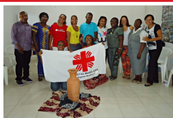
Grupo durante encontro da sede

A realização de intercâmbios é uma metodologia usada pela Cáritas como possibilidade de integrar grupos sociais que vivem em realidades distintas, com avanços e desafios a serem superados, e que se reúnem e interagem para aprender e trocar uns com os outros. E foi isso que aconteceu de 03 a 08 de novembro, em Salvador/BA, entre representantes da Cáritas Regional Nordeste 3 e da Cáritas de Angola: troca de experiências e construção de saberes. Leia mais