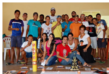
Jovens participantes do encontro

“Dança aí, negro nagô! Dança aí, negro nagô oh oh oh...”